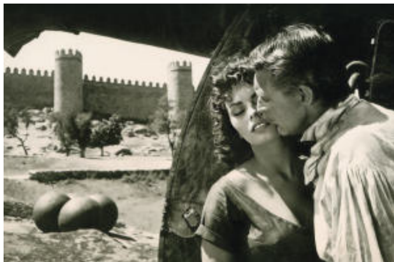
Exposición Castilla y León: Escenario de Cine

Septiembre - Sala de exposiciones temporales