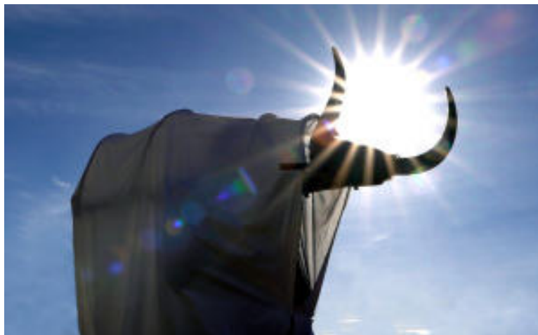
Documental Toro de Carnaval de Morales de Valverde , de Óscar Antón

Biblioteca Pública de Zamora V 20 - 19:00 h - Salón de actos